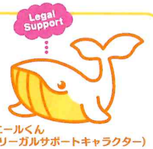
エールくん (リーガルサポートキャラクター)