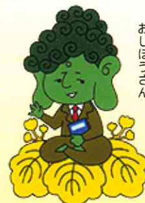
奈良県司法書士会キャラクター おしほうさん